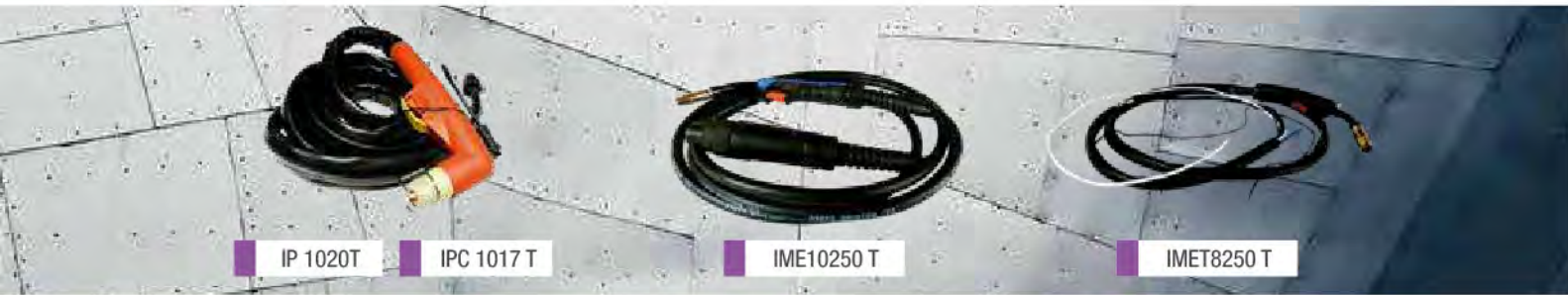
IP 1020 T