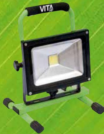
RL 1020 EL