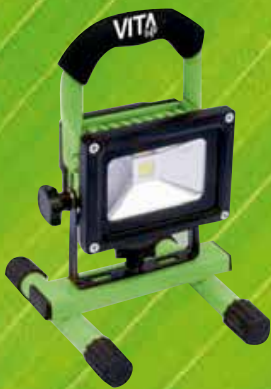
RL 1010 EL