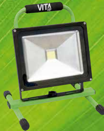
RL 1030 EL